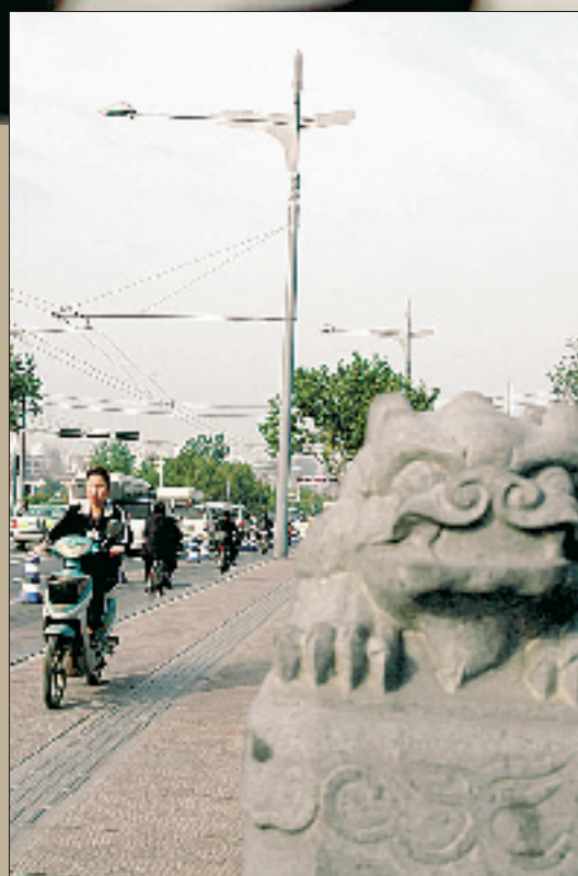
大关桥蛟龙石雕及戟形路灯

京杭大运河全长1794公里,从隋朝流到现在,古代把朝廷的统治带到了杭州,也把南方的粮食和特产带去了北方。