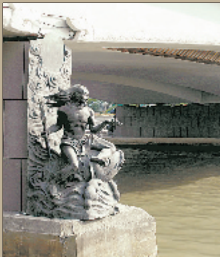
潮王桥下潮王铜像