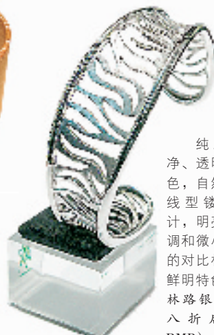
纯正、干净、透明的银色, 自然的流线型镂空设计, 明亮的色调和微小细腻的对比如构成了鲜明特色。(武林路银时代, 八折后 380 RMB)