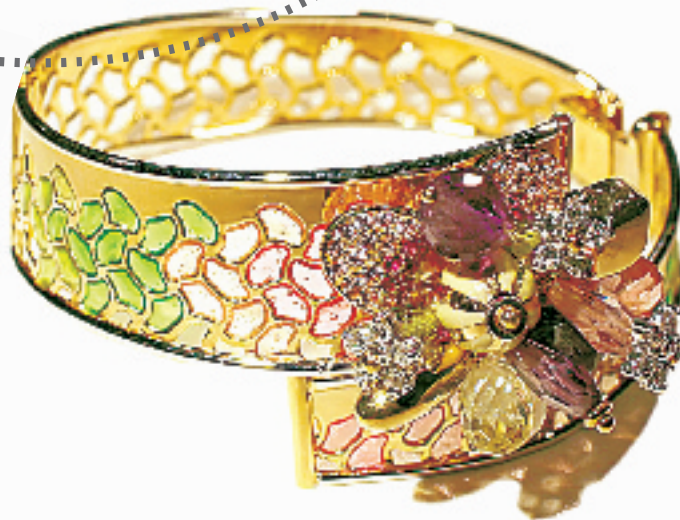
18K 金加上石榴石、黄玉、粉金等半宝, 鲜艳亮丽的色调和纯正、干净、透明的色彩营造出特别的氛围, 显得春意盎然。(杭州大厦六福珠宝专柜, 17903 RMB)