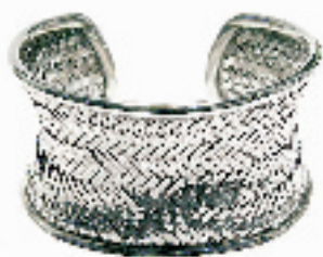
这是一种奇妙的结合, 纯银的材质却勾勒出竹编的效果, 精致、传统而不墨守成规。(武林路银时代, 八折后 605 RMB)