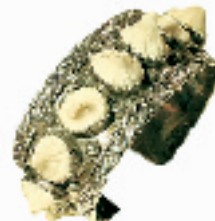
圆锥状乳白色的鲨鱼牙,搭配复古的波纹、圆润的银珠,谁说温柔与胆量不能并存?(银泰百货海盜船专柜,1250 RMB)