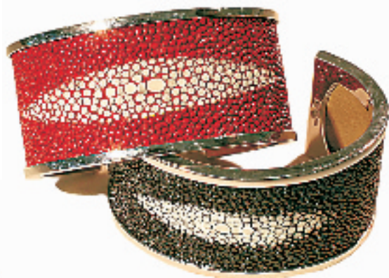
独具民族风格的仿鳄鱼皮手镯,野性十足,亚马逊河的原始风情跃然而出。(银泰百货 Follie Follie 专柜,1425 RMB)