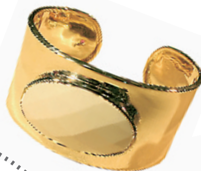
摒弃了复杂的多余装饰,只嵌一颗抛光过的白色大玛瑙,简洁大气。(银泰百货 ELLE 专柜,988 RMB)