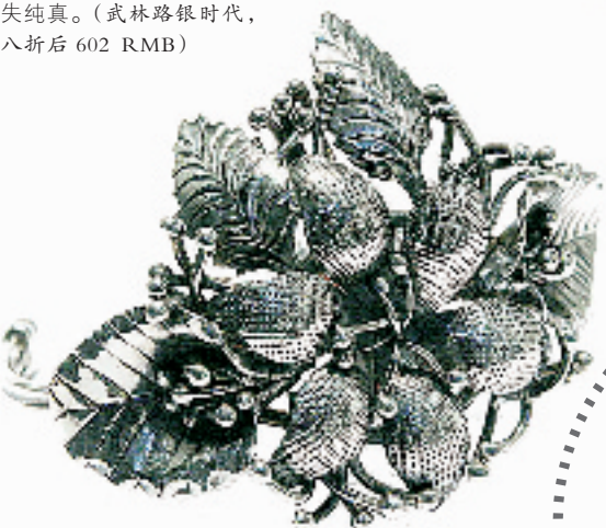
抢眼的银色花朵不论花瓣还是叶子都脉络分明,就连花蕊都根根清晰,给人的感觉青春活泼又不失纯真。(武林路银时代,八折后 602 RMB)