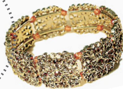
混合流行复古元素的金手镯奢华夺目, 散发出撩人性感的华丽风情。(银泰百货 MONET 专柜, 608 RMB)

2006年, LV 推出了浑然天成、大气硬朗的钢质手镯, CHANEL 的白色手镯装饰了甜美的心型和蝴蝶结, Fendi 的设计师也不甘落后, 紫红色的手镯上镶嵌了闪闪发亮的水晶。于是, 眼花缭乱的巨大手镯就开始频频出现在人们的视线之内, 无论是什么风格的手镯, 它们都拥有 5 厘米左右的宽度, 厚重的金属质感, 让人不可小觑。今年夏天, 大手镯到底有多热?