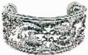
不对称的花朵图案雕刻在做旧的手镯上,古典中带着些许神秘,似乎在诉说着上个世纪的欧洲宫廷故事。(武林路银时代,八折后 360 RMB)