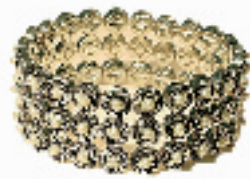
类似古钱币造型的手镯上镶嵌着颗颗珍珠,运用气质典雅的淡色元素,传达典雅而奢华的品位。(银泰百货 MONET 专柜,628 RMB)