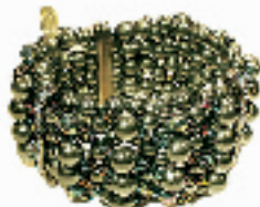
数十颗大小不一的黑色工艺珠子随意地穿成几排,如黑珍珠般折射着五彩光芒。(杭州大厦 EVITA RERONI 专柜,400 RMB)