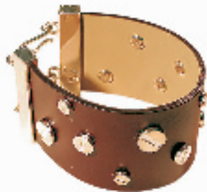
简单别致的咖啡色皮质手镯上钉着金属铆钉, 将摇滚风和街头感大大演绎了一通。(银泰百货 ELLE 专柜, 988 RMB)