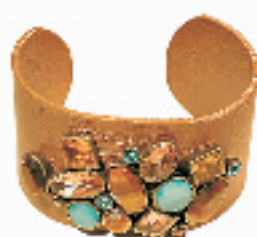
镶着闪亮琉璃石和彩色水晶的 EVITA RERONI 褐色宽皮手镯, 如维多利亚时期的贵族, 充满高贵与无限的自信。(杭州大厦 EVITA RERONI 专柜, 899 RMB)