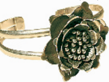
大方可爱的花朵装饰神秘绚烂夺目,使花样少女越发俏丽可人。(银泰百货海盜船专柜,759 RMB)