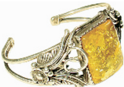
瑰丽的金黄琥珀不时漫射出耀眼的阳光, 思绪随着时间向前追述, 空气中隐约夹杂着淡淡的松脂香味。(银泰百货海盜船专柜, 1250 RMB)