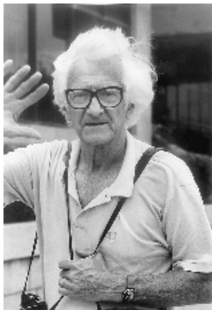
行走中的马克·吕布