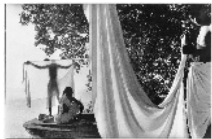
贝拿勒斯 印度 1956