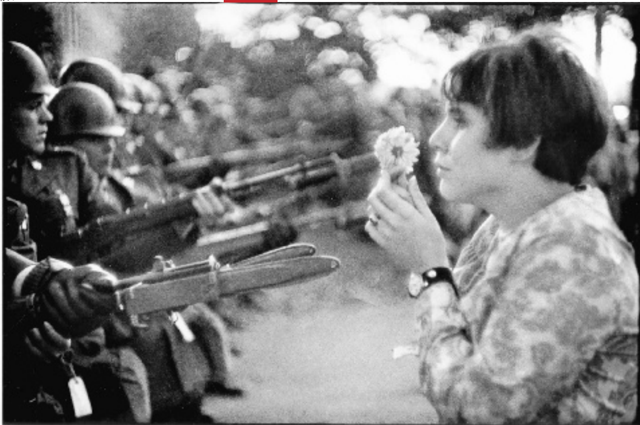
10月21日五角大楼前反越战游行 华盛顿 美国 1967