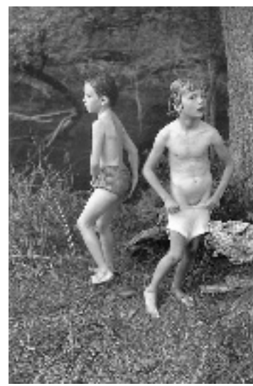
两个女孩 薄酒莱区 法国 1951