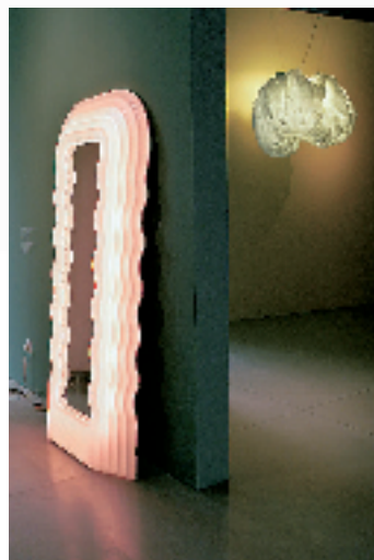
作品:镜子“超级草莓” 设计者: Ettore Sottsass 设计时间: 1970 年