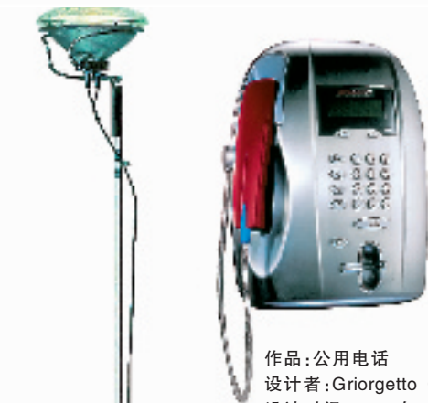
作品:公用电话 设计者: Giorgetto Giugiaro 设计时间: 2000 年