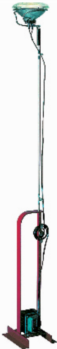
作品:灯“Toio” 设计者: Achille Castiglioni 设计时间: 1962 年