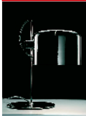
作品:灯“Coup é” 设计者: Joe Colombo 设计时间: 1967 年