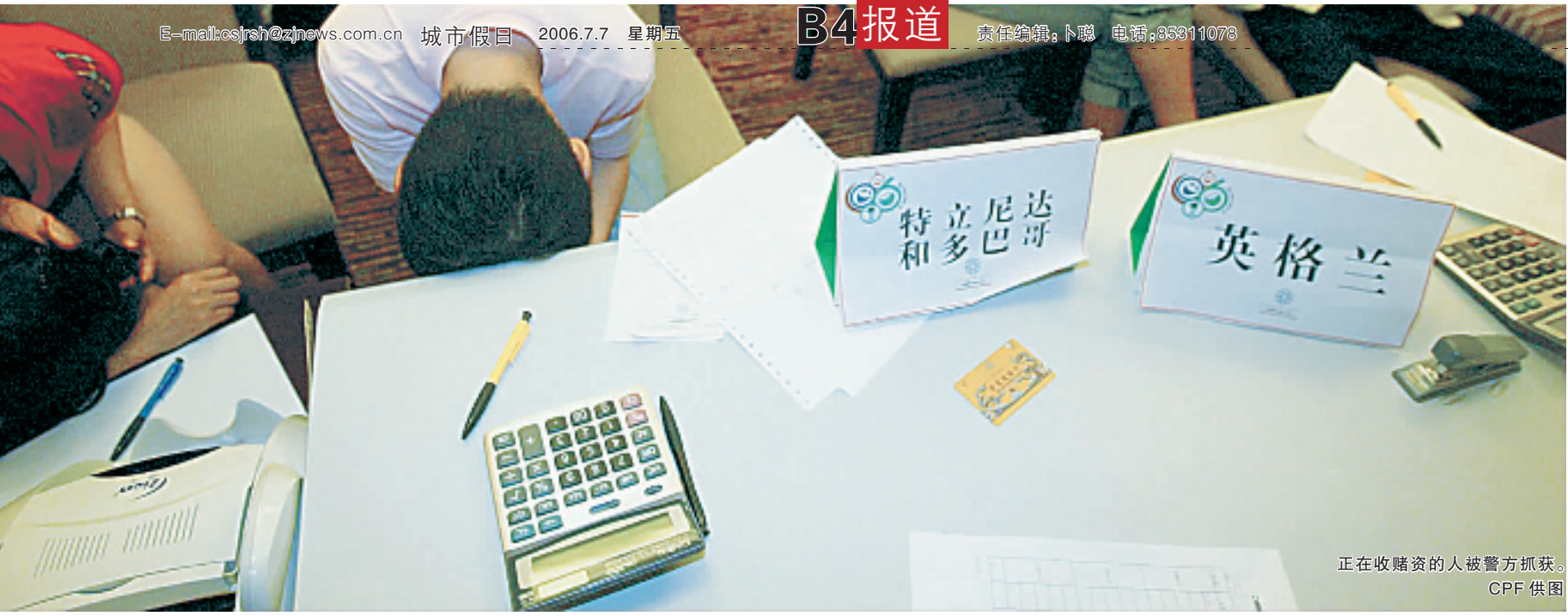
正在收赌资的人被警方抓获。