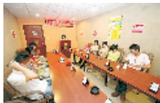
游戏中每个人都懂得要伪装