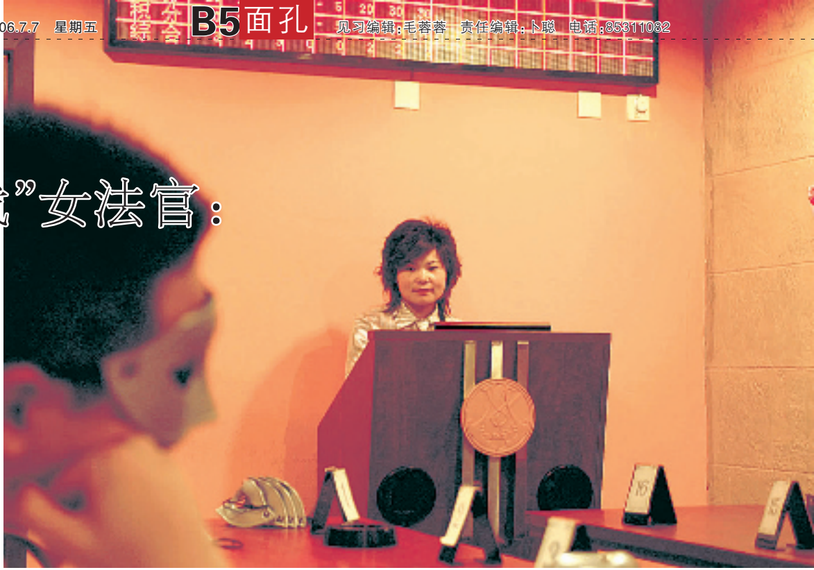
游戏法官执法也很严格。