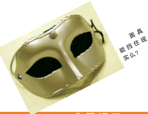
面具能挡住现实么?