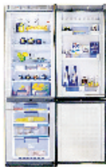
博世激彩系列冰箱(赠价值 458 元博世三明治机 + 美的立式饮水机)

海尔冰箱一直做得非常时尚,海尔推出的三门冰箱创新性地第三个温室设计成变温室,可以实现 0℃ 至 -18℃ 的自由转换。当 0℃ 时是保湿保鲜区,水果、生鱼片、凉菜等对水分保持要求严格的食品可以放在该温区,精确调控温、湿度,双重保护食品在短期内的新鲜;当变温室转换到 -7℃ 时则变成软冷冻保鲜区,适合存放肉类食品,取出后无需解冻即可时切;调节到 -18℃ 后就变成了冷冻室,解决了节日期间冷冻室容积不够的烦恼。