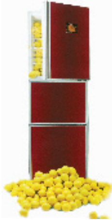
海尔全系列产品(海尔旧冰箱换购海尔新冰箱另加送价值 100 元的赠品)

三星的三开门冰箱高档时尚,其采用的外观色彩都是当下最为流行的色彩元素,配合高技术含量的曲面玻璃构成弧形炫彩面板,不但摒弃了平面面板的呆板单调,而且尽显高贵气质。该冰箱的中间变温室可以实现 22℃ 的变温范围,可更好地满足不同食物对储存环境的特殊要求。对于有不同温度需求的食品,你可以在零下 12 度到零上 10 度之间任意选择,想怎么变就怎么变,与其它普通冰箱 10 度左右的可变温幅度相比,可谓大大方便了储藏需求。同时,当冷藏空间不足时,变温室可自由调节为冷冻室,当需要更大冷冻空间,则可以变为冷冻室,真正实现了冷冻与冷藏的自由变换。