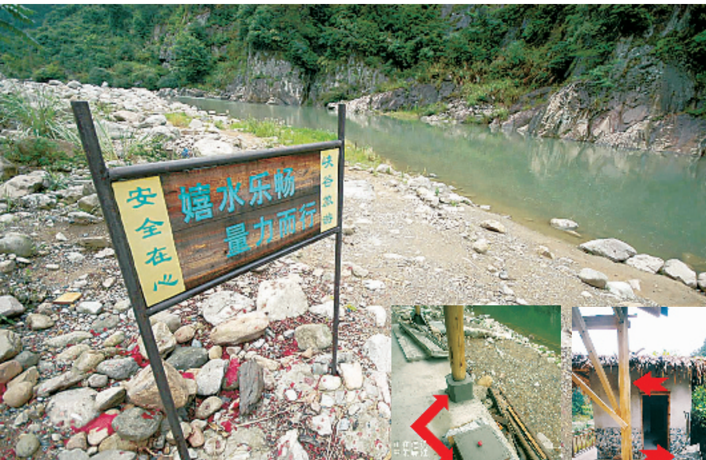
潭边立的牌子,旅游公司说这就是警示牌。