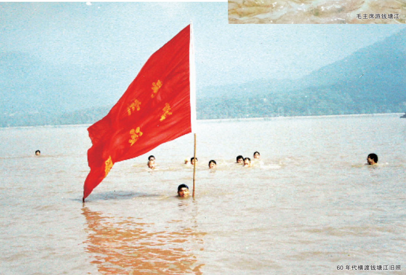
60年代横渡钱塘江旧照