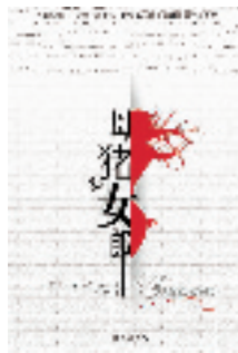
《母猪女郎》 (法)玛丽·达里厄塞克著 重庆出版社 定价:18元

还有一件厉害的事,她写这篇小说,只用了600个法语单词。粗糙但是精准,还不仅仅是明晰的问题。《致中国读者》中,玛丽·达里厄塞克如此写道:“到达中国的时候,我根本不知道什么东西在等待我。一切都比我想象要现代、要大、要猛烈,一切都撞击着我,使我印象深刻,让我感到震惊。我没想到中国是这样的,跟我们在法国报纸上读到的不一样。在欧洲,许多人都说,未来属于中国。这是摆着的事,是废话。这句话人们不知重复了多少遍,却不清楚它究竟是什么意思。在来中国的10年之前,当我写《母猪女郎》的时候,我描写了一个可能出现的未来,一个噩梦般的未来,我希望无论是中国还是欧洲都不要有这样的未来。”