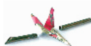
上两图为黑心钉实样