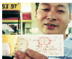
司机展示出租车燃油附加费定额发票

8月1日开始,杭州打的须支付一元的燃油附加费。收费第一天出了不少花絮,有一位的哥被乘客误会乱收费,无奈之下拨打了 110。经过民警协调,才解开误会。还有老外看不懂中文说明,拒绝付这一块钱。