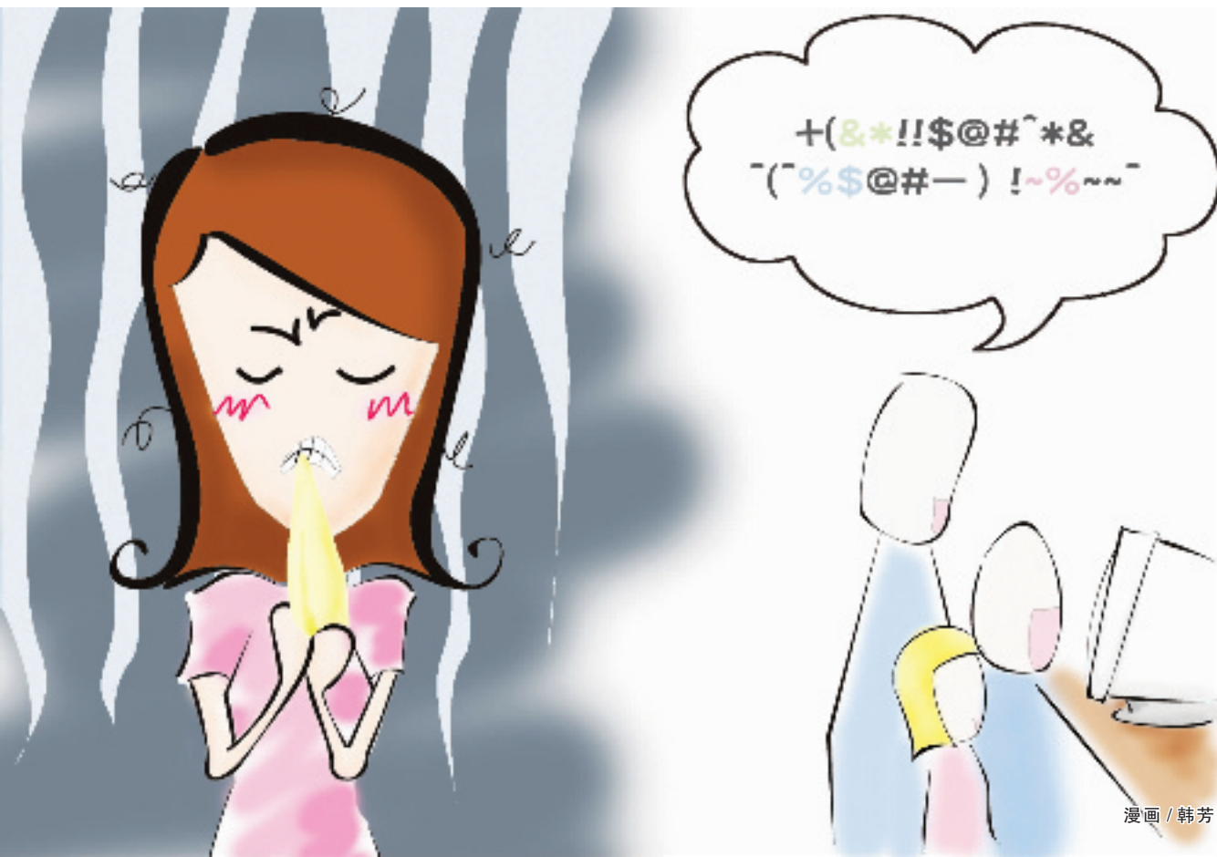
漫画 / 韩芳

跟恋人聊的私密话,第二天却成了同事们的口头禅,原因就是 MSN 聊天记录被公司的技术部门监控,然后又被泄漏——因为这,日前上海某企业工作员工把辞呈递给了公司。