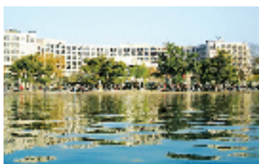
凯悦酒店,坐拥西子。