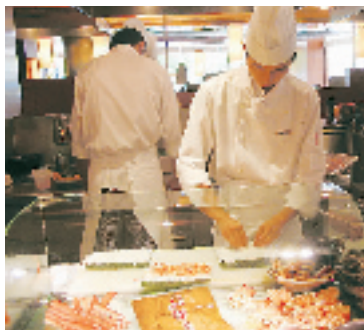
开放式厨房里,厨艺成为演艺。

上周六的傍晚,我驾着新买的蓝瑟小车,去参加一个老同事的聚会。聚会地点选在了杭州凯悦酒店的 BUFFET 厅, BUFFET 在英语和法语中都是自助的意思,那也是我喜欢聚会方式,轻松又愉快。