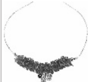
采样地:万隆珠宝·钻石世家

在这里,笔者为你搜罗了MCLON万隆珠宝“秋日私语”K-gold 18K金饰系列的几款饰品。因为有了它们的点缀,无论何种气质的你,都能在秋风怡人的季节中,写出浪漫生活的感觉。