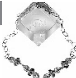
采样地:万隆珠宝·潮流名品店

现在,许多时尚MM都推崇首饰佩带的特例独行,那么MCLON“瓦妮莎的微笑”系列一定会成为你的首选。这款套链将无数的硕果串连在一起,夸张地展现了复古的奢华,让你成为晚宴中瞩目的焦点。值得一提的是,将套链的外圈取下,又可以做手链单独佩带,实用价值超高吧!