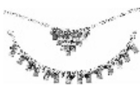
采样地:万隆珠宝·钻石世家

青春潮人,时尚活泼,最适合性格甜美的娇娇女,MCLON“爱的纪念”可人吊坠,以多彩的花朵图案配以K-GOLD,设计清新趣致,突出年轻女郎既乖巧、又刁蛮的好玩个性。