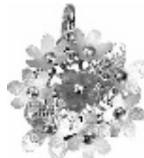
采样地:万隆珠宝·钻石世家

简约尔雅的款式,加上雅致的设计,配合裙褂、晚装,展现最美的一面,发挥醉人韵味。MCLON“秋日私语”项链适合所有的爱美女性,在隆重的场合,尽显女人的妩媚风采。