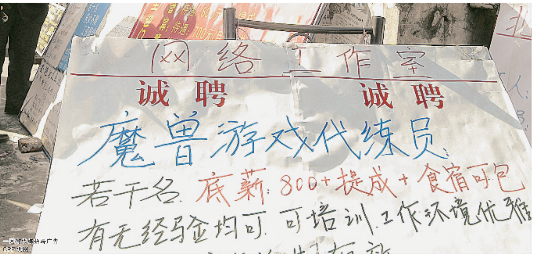
一网游代练招聘广告