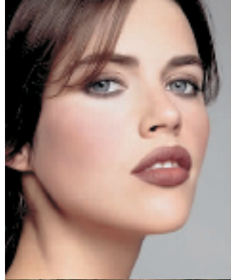
BOBBI BROWN 巧克力迷情