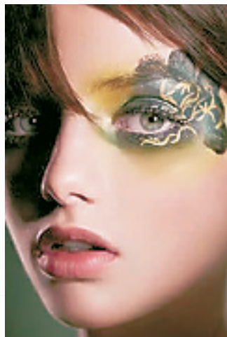
植村秀的光影游戏