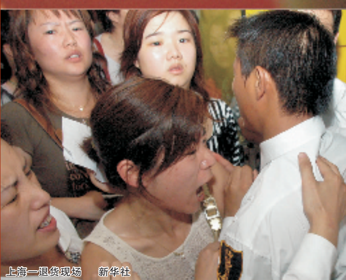
上海一退货现场 新华社

去年SK-II的“烧碱风波”和虚假广告事件尚未完全淡出人们的记忆,近日,这一著名化妆品品牌又一次出现产品成分问题:SK-II 9种化妆品被发现含有禁用物质铬和钨,其中净白素肌粉饼的钨成分高达4.5mg/kg。 一夜之间,SK-II成了最热门的话题。北京、上海等城市相继出现退货潮,心急的消费者甚至一怒之下砸了柜台,SK-II事件自此升级。 没过几天,消费者又听说倩碧、雅诗兰黛、迪奥、兰蔻这四大品牌也“出事了”,据香港方面检测,相关粉饼也存在铬和钨。 除了消费者,还有一些人的生活也被“金属事件”所改变,她们有的是跨国集团的公关负责人,有的是商场高管人员,有的是专柜资深BA(美容推广人员)……作为该事件最前沿的工作人员,他们直接面对的是消费者的种种愤怒。 有人说,这其实就是一场没有硝烟的战争,谁才是真正的受害者? 本报记者采访了几位当事人,希望呈现发生在身边的最真实的“金属”风波。