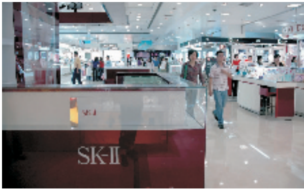
银泰已撤空的SK-II专柜

者,还得罪了全国最好的商场。林立说,后来才从宝洁得知,他们原本打算“冷处理”SK-II事件,避免更多消费者在退货的时候发生冲突,这才一夜之间突然撤柜。但是,这样的冷处理,无疑是把一盆凉水浇到了热油锅里。