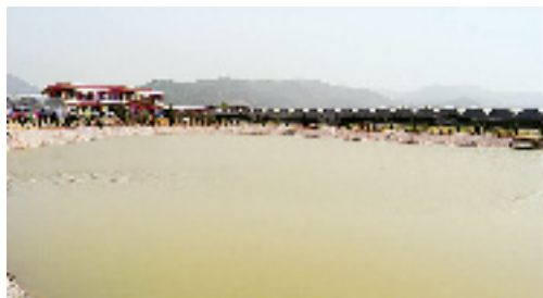
森山铁皮枫斗千亩仿野生GAP栽培基地