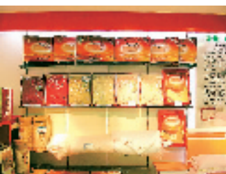
100%蚕丝被 淘宝价:190元-400元

继首团义乌淘宝团开团以来,我们的淘宝团成功组织了六百多人完成了三次淘宝之旅。淘宝团以实实在在的折扣和服务赢得了广大读者的至高评价,除了来电表示对该活动的喜爱之外,不少读者也提出了不少建议和想法。比如在行程设置上增加购物时间;能不能再增加一些淘宝产品等等。有读者建议,天气冷了,能不能去羊毛衫市场等等。