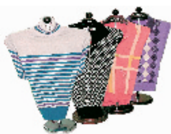
全羊毛线衫 市场价:400元 淘宝价:225元