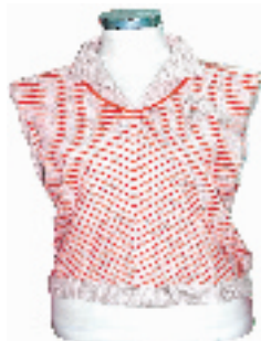
全羊毛红条女线衫 市场价:425元 淘宝价:208元