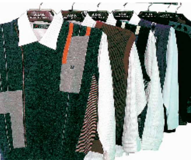
花花公子男款羊毛背心 市场价:520元 淘宝价:270元