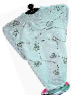
50%羊毛圆领线衫 市场价:150元 淘宝价:78元