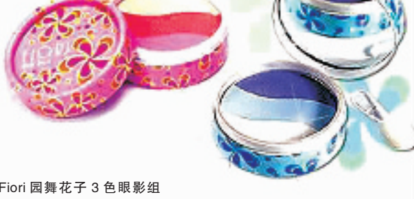
日本 Fiori 园舞花子 3 色眼影组