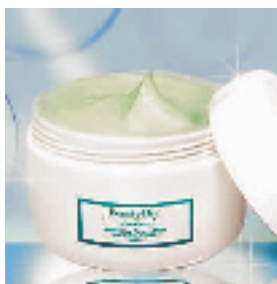
▼牛尔绿石泥毛孔紧致面膜