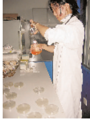
无菌室里做培养皿