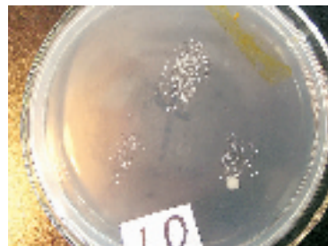
使用舒肤佳香皂洗手后细菌繁殖情况——细菌分布比较分散。