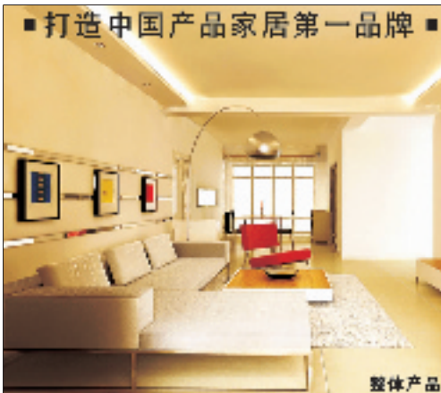
整体产品家居展示图