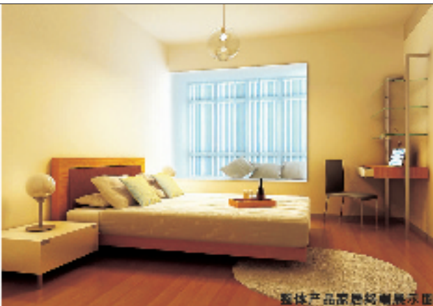
整体产品家居展示图

整体产品家居 整体产品家居包括:墙面装饰、全套品牌家具、整体厨房、整体卫浴间、全套厨卫用品、整体卫浴、全套五金配件、智能系统(灯光系统、电动窗帘系统)等 整体产品家居使用的品牌:意大利水管、多乐士乳胶漆、中德威通电话、美森耐墙腻子、天来乳胶漆、友邦集成吊顶、马可波罗瓷砖、YOLU名瓷沙发、kall. 菲丽碧、BIVARY、MOBYL、安友全套品牌洁具、全套卡萨帝布艺窗帘、意大利真瓷装饰画、诺贝尔卫浴、松下洁具、TOTO、澳斯、飞利浦、高登整体橱柜、固步整体、三德名瓷挂镜框、灯具、油漆等、名牌灯具等。