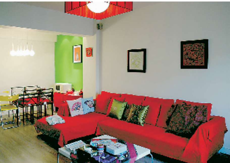
古儿家红红绿绿的客厅