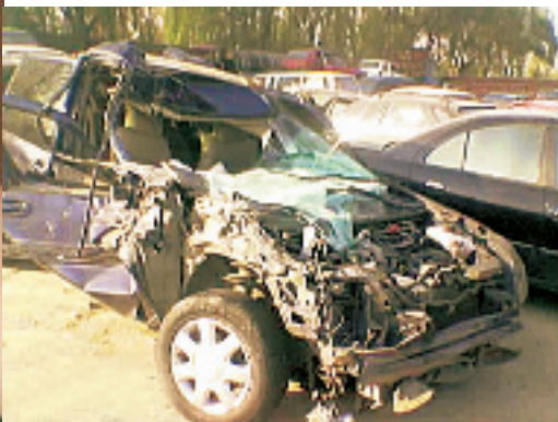
文 / 本报记者 金丹丹

最近不少明星都挺倒霉。胡歌车祸毁了容,刘力扬弄伤了脚,前天上午,一直负面新闻不断的何洁在高速公路上遭遇大车祸。车子被撞得惨不忍睹,所幸的是只有皮外伤,没有大碍。 记者昨天中午打电话给何洁的经纪人张红凯。张红凯说自己到现在才算小吁了口气。前天凌晨三点左右,何洁刚刚在石家庄录完河北卫视的一档节目,和几个工作人员连夜驱车赶回北京,结果在高速路上,一辆大卡车要从后面超车,直接撞到了何洁等人乘坐的别克商务车上。 “何洁当时坐在司机后面的那个座位上,所以伤得不是最重。交通部门跟我们