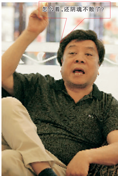
怎么着,还阴魂不散了?