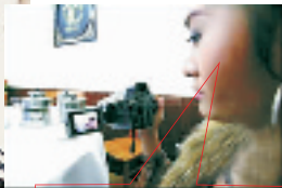
就是这卷带子,他们跑不了。