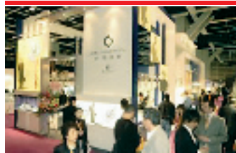
今年 9 月,“主席金钻怀表”参展香港国际钟表展,好评如潮。

诞生于 16 世纪的怀表是古董表的典范,充满了怀旧的色彩,一直是社会名流极力收藏与互赠的物品。1945 年主席赴重庆谈判时,郭沫若曾亲手将一块纯银怀表赠送主席,以表崇敬心情。主席对该表十分珍视,多次对身边的人员谈起这块怀表。依据这块怀表的尺寸与外形,钟表大师们终于完成了“怀念毛泽东”金钻怀表的设计,并化一成千,创作了一款传留后世的钟表杰作。近十年来,古董怀表一直是钟表拍卖会上竞拍激烈的焦点,其升值之快几乎无可比拟。1993 年,国家有关部门发行过一款“毛泽东诞辰 100 周年纯银怀表”,10 多年过去了,这款表曾在去年香港举办的古董表拍卖会上拍出了 6 万多港币的高价,增值了 10 多倍。专家指出,主席题材藏品一直被藏家看好,“怀念毛泽东”更将成为红色收藏的风向标。