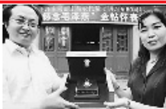
近日,广州农讲所收藏该表第 1926 号以纪念毛泽东主持农讲所 80 周年。