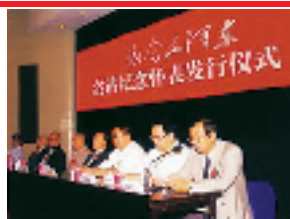
毛泽东逝世 30 周年纪念来临之际,本表在北京举办发行仪式,全国人大副委员长王光美(左三)、中国钟表协会会长汪孟晋(右二)等同志在主席台就座。