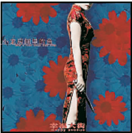
幸福大街的第一张专辑封面

都觉得我还不错。因为我们早先的的音乐偏另类,大众一般接受不了。可能年轻的时候特别希望别人接受,但是现在,真的无所谓了。”