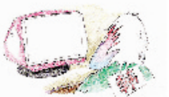
捣鼓“韩寒开房”把韩寒气得