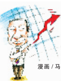
漫画 / 马骥