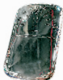
PEACOCK 怀炉 搜索地:杭州大厦 zippo 专柜 价格:278元