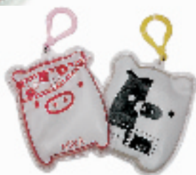
情侣暖手蛋 搜索地:环北 价格:10元一对