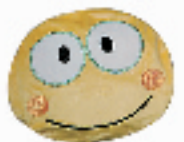
电暖袋 搜索地:环北 价格:20—30元