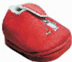
暖脚宝 搜索地:环北 价格:45元