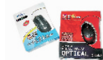
USB 光电保暖鼠标 搜索地:文三路老高新电脑城 306 优惠价:39—59元