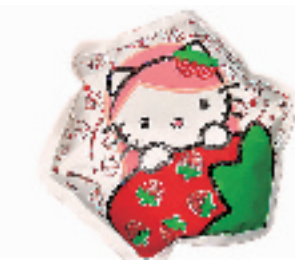
电暖袋 搜索地:工联 B-B30 价格:20—25元