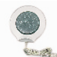
USB 杯垫 搜索地:文三路老高新电脑城 306 价格:市场价45元,优惠价35元