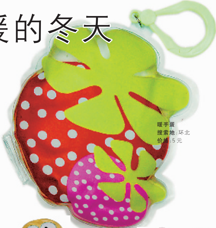
暖手蛋 搜索地:环北 价格:5元

每年冬天,寒风刮起的时候,那些暖手、暖脚的小玩意,总是卖得出奇的好,今年也不例外。记者搜索了杭城的一些商场和市场,发现今年的暖手产品变小了,小得可爱,KITTY猫、黑白猪、绿豆娃……卡通们唱起了主角,大摇大摆地跑进年轻人的包包里。