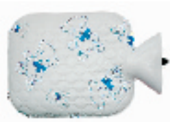
加厚的电暖袋 搜索地:环北 价格:30元