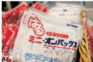
暖暖包 搜索地:特立屋 价格:5.5—6元 分为可贴式和便携式 两种,便携式6元,可贴式5.5元。