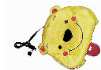
USB 电热暖手鼠标垫 搜索地:文三路老高新电脑城 306 价格:市场价49元,优惠价35元