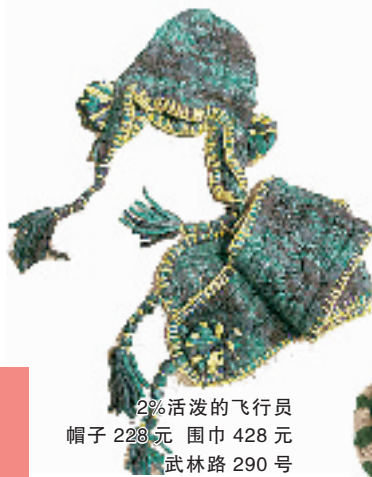
2% 活泼的飞行员 帽子 228元 围巾 428元 武林路 290号