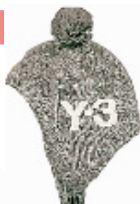
Y-3 帽子 800元 杭州大厦 B5楼