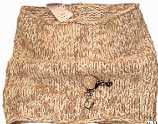
围巾 690元 狮虎桥路 43-5-101