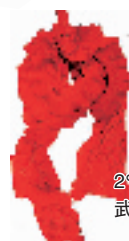
2% 红围巾 269元 武林路 290号

总是躲在灰暗的色彩里,虽然那是好搭配的最安全方法,但是衣柜里怎么可以永远都是黑色呢?偶尔来点鲜亮吧,活泼的飞行员帽子,或者鲜亮的围巾,即使撞色也有撞色的乐趣。虽然小米已经不再是学生,可是永远是青春的鲜艳打扮。2%的红色围巾,米奇的白色T恤,再加上BETTY的发卡,b+ab绿色帆布裤子,和围巾一样颜色的雪地靴,绝对是最为抢眼的撞色搭配。冬天总不能因为气温的关系而死去沉沉吧,记得要打起精神,扮成活泼的精灵也不错,新年里做个喜气的宝贝吧。