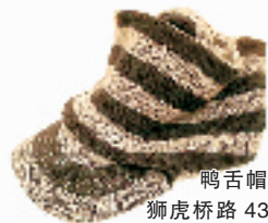
鸭舌帽 390元 狮虎桥路 43-5-101