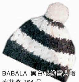
BABALA 黑白毛线雪人帽 59元 武林路 164号