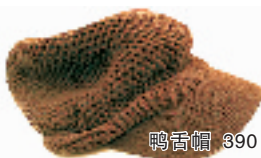
鸭舌帽 390元 狮虎桥路 43-5-101