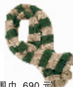
围巾 690元 狮虎桥路 43-5-101