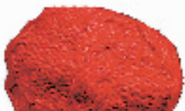
BABALA 帽子 59元 武林路 164号