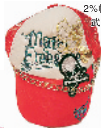
2% 帽子 198元 武林路 290号