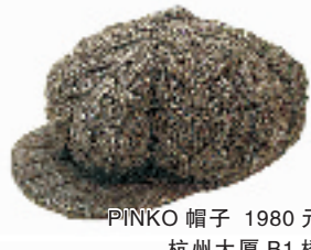
PINKO 帽子 1980元 杭州大厦 B1楼