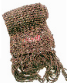
D&G CAVALLI 金丝围巾 1430元 杭州大厦 B1楼