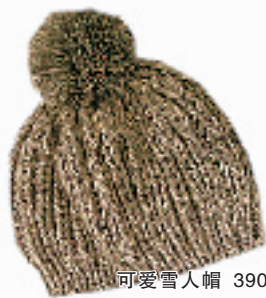
可爱雪人帽 390元 狮虎桥路 43-5-101