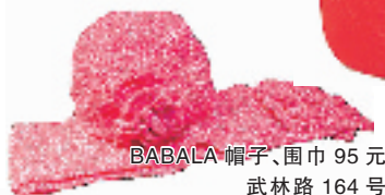
BABALA 帽子、围巾 95元 武林路 164号