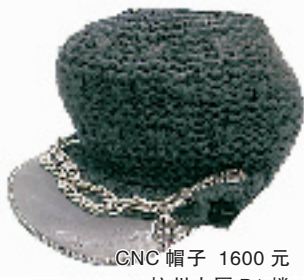
GNC 帽子 1600元 杭州大厦 B1楼