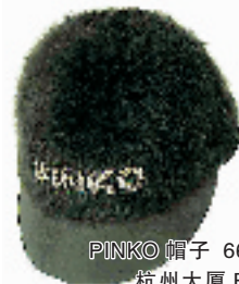
PINKO 帽子 660元 杭州大厦 B1楼