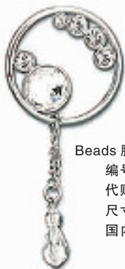
Beads胸针 编号:011208 代购价:498元 尺寸:6.1 x 2.7 cm 国内参考价:830元