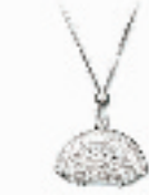
闪亮钱包挂坠 编号:011219 代购价:690元 尺寸:42 / 2.5 x 3.6 cm 国内参考价:1150元