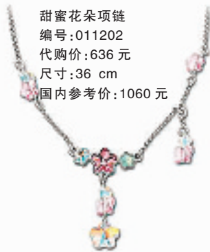
甜蜜花朵项链 编号:011202 代购价:636元 尺寸:36 cm 国内参考价:1060元