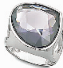
蓝丝绒戒指 编号:011203 代购价:690元 尺寸:42 / 2.5 x 3.6 cm 国内参考价:1150元 戒围有三个尺寸:52,55和58。