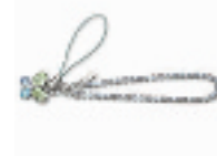
蝴蝶手机链 编号:011216 代购价:378元 尺寸:17 cm 国内参考价:630元