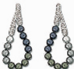
Bidane Pierced耳环 编号:011210 代购价:636元 尺寸:5.9 cm 国内参考价:1060元