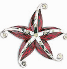
海星胸针 编号:011218 代购价:690元 尺寸:4.8 x 4.2 cm 国内参考价:1150元