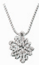
Amarante挂坠 编号:011221 代购价:822元 尺寸:38 cm 国内参考价:1370元