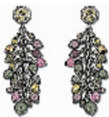
Bergamote Pierced耳环 编号:011214 代购价:1242元 尺寸:7 cm 国内参考价:2070元