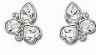
Glamour Clip耳环 编号:011222 代购价:540元 尺寸:2.1 cm 国内参考价:900元