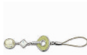
Jonquil手机链 编号:011206 代购价:440元 尺寸:17 cm 国内参考价:740元