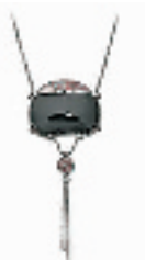
小竹钱包挂坠 编号:011223 代购价:1500元 尺寸:75 / 4.5 x 11.5 cm 国内参考价:2500元