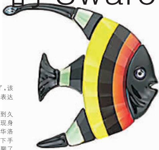
卡拉巴胸针 编号:011201 代购价:690元 尺寸:3.8 x 4.2 cm 国内参考价:1150元

如果你有任何疑问,请打电话到85310806咨询。付款以后即表示认同我们的代购方式,货品在无质量问题的情况下不接受退换货要求。汇款截止日期:1月18日下午17点整。