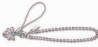
心型手机链 编号:011205 代购价:380元 尺寸:17 cm 国内参考价:630元