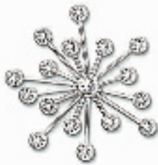
哈利胸针 编号:011209 代购价:540元 尺寸:4.7 cm 国内参考价:900元