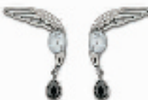
Bird Pierced耳环 编号:011217 代购价:720元 尺寸:7cm 国内参考价:1200元