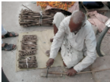
印度人喜欢用这种树棍刷牙,这是市场上卖牙刷的小贩。