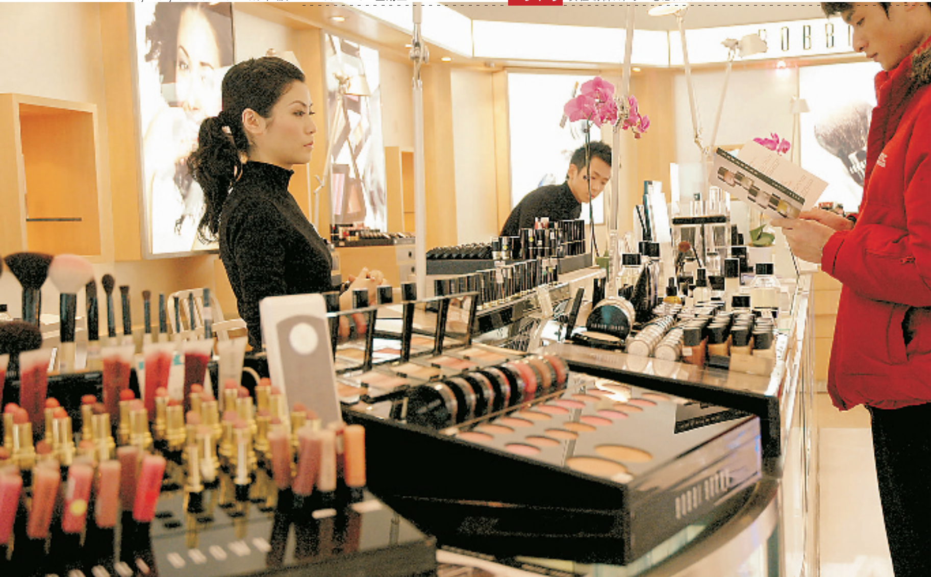
商场的化妆品柜台常有男士光顾