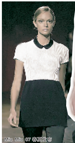
Miu Miu 07春夏发布