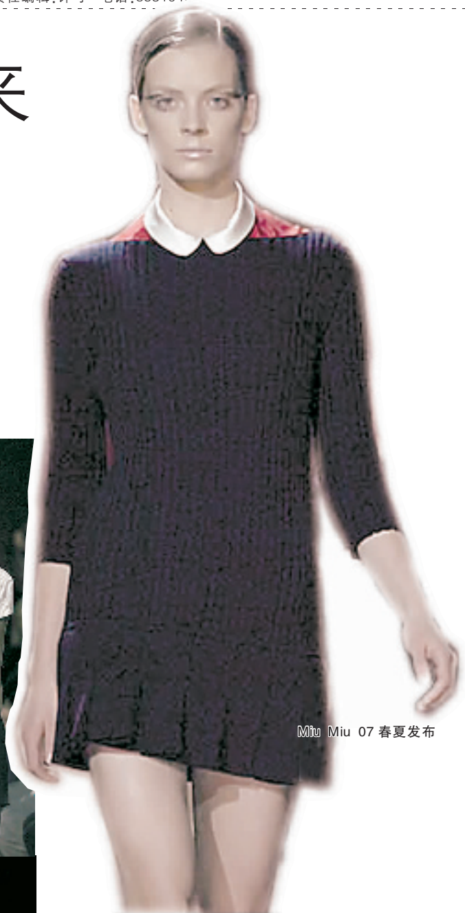
Miu Miu 07春夏发布