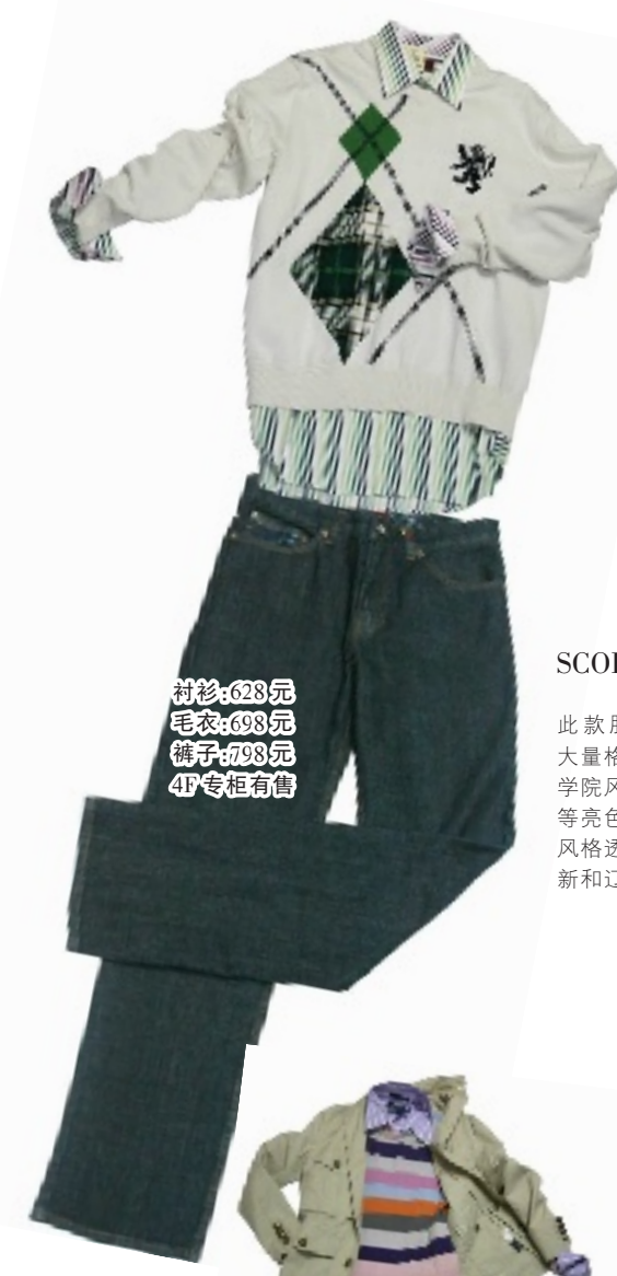
衬衫:628 元 毛衣:698 元 裤子:798 元 4F 专柜有售

MOJO 在 07 春夏带来的是属于女性的随性,优雅中流露潇洒.加上 CC CLUB 的简约明快,典雅.完美地展示女性自然美.