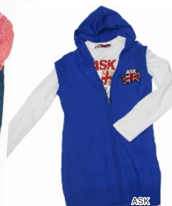
同样的蓝白配色,却隐含着街头的运动嘻哈风格.适合青春活力的你. T恤:230 元 针织衫:905 元 5F 专柜有售

贝纳通最出彩的就是她出神入化的色彩搭配.粉色系的毛衣搭配牛仔裤,展示女性甜美、自然的一面.