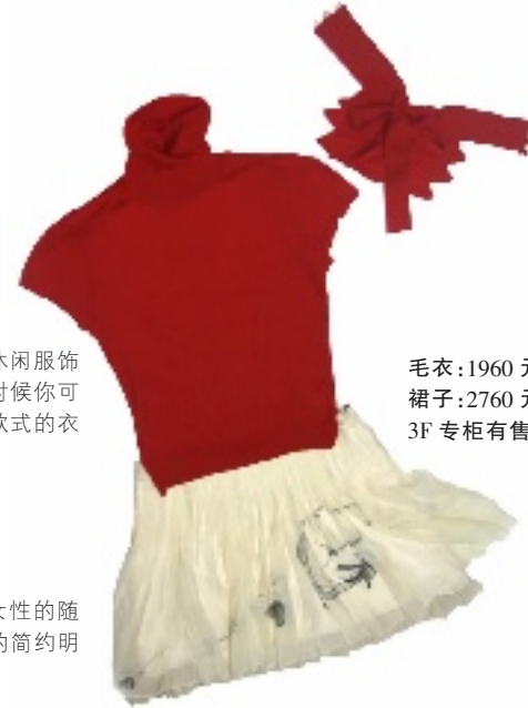
毛衣:1960 元 裙子:2760 元 3F 专柜有售

到处走访朋友,正是穿着不同休闲服饰与亲朋好友放松心情的好时机.这时候你可以根据每天赶场的需要来变化不同款式的衣服,让你每天都有一个好心情.