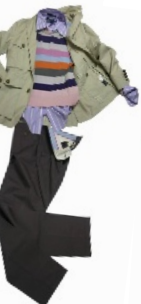
外套:3980 元 衬衫:1080 元 毛衣:2390 元 裤子:1080 元 4F 专柜有售

DANIEL CREMIEUX 的这套服装不仅用料考究更注重色彩与细节的搭配,又呈现出稳重又不失轻松的情趣.