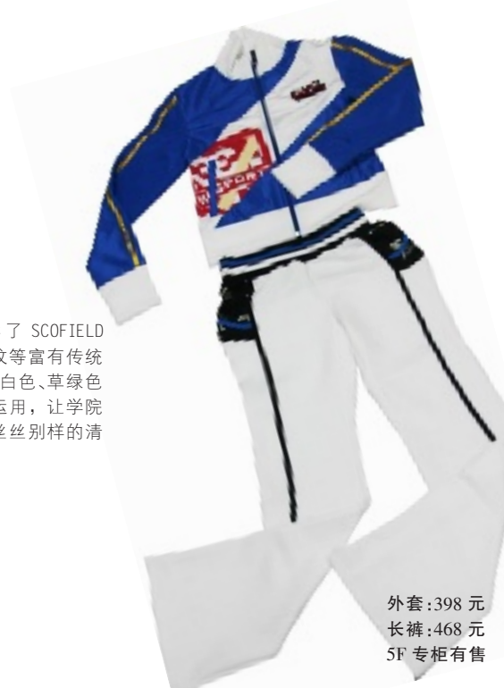
外套:398 元 长裤:468 元 5F 专柜有售

此款服装延续了 SCOFIELD 大量格子 and 条纹等富有传统学院风格图案,白色、草绿色等亮色的大量运用,让学院风格透露出一丝丝别样的清新和辽远气息.