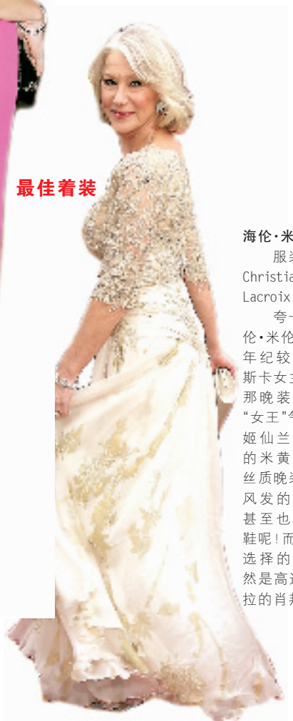
海伦·米伦 服装品牌: Christian Lacroix

夸一夸: 海伦·米伦虽然是年纪较大的奥斯卡女主角,但那晚装扮颇有“女王”气质。穿姬仙兰卡出品的米黄色绘花丝质晚装,意气风发的她脚下甚至也是绣花鞋呢!而“女王”选择的钻饰竟然是高达 62 克拉的肖邦胸针!