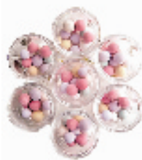
娇兰幻彩流星粉球(10颗,正品分装,盒子为赠品)

这款接骨木花眼胶是BODY SHOP 产品中最受欢迎的,质地透明并散发淡淡的植物清香,着哩状的眼胶不粘手,使用起来特别清凉。对改善黑眼圈和浮肿的情况特别有效。接骨木是一款珍贵的可以入药的植物,它的花含有转化糖、果酸、单宁酸、维生素C和生物类黄酮等多种成分,使用以后能令双眸看上去炯炯有神,就算再熬夜也不怕!