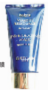
娇兰 保湿清新面膜 30ml

“幻彩流星”是粉饼中最为昂贵的,她的奇妙之处在于用五彩的颜色来焕发脸部的生机。如流星的彩色粉球能随着光影的变化而衍生出不同美感。只需用散粉刷轻轻蘸取轻刷,就能令肌肤闪闪生辉,效果出众!