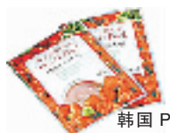
韩国 POSS 面膜

口碑非常好的保湿面霜,用过的都知道,润而不腻,抹在脸上很舒服。特别适合干燥缺水的皮肤,即使最敏感的皮肤也能使用。含有维他命E,能保护皮肤不受伤害。