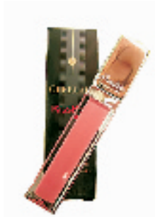
娇兰 KISSKISS 流金亲亲唇彩 6ml

此款面膜使用完能感觉到肌肤轮廓变得紧实,肤质变得柔润平滑,充满弹性。坚持使用一个月后,就能感觉脸部变得有线条感了,脸会在不知不觉中变小!