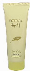
韩国 DEOPROCE 绿茶面膜 180G

滋润保湿,绝对超值,适合偏干性皮肤,便宜又好用。强烈推荐给干性肌肤的MM们使用。