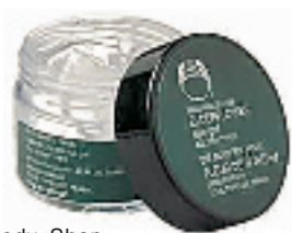
The Body Shop 接骨木花眼胶(眼霜)