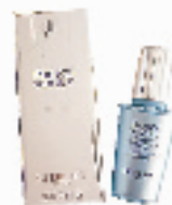
娇兰完全深彻靓白C 美白精华 10ml

“幻彩流星”是粉饼中最为昂贵的,她的奇妙之处在于用五彩的颜色来焕发脸部的生机。如流星的彩色粉球能随着光影的变化而衍生出不同美感。只需用散粉刷轻轻蘸取轻刷,就能令肌肤闪闪生辉,效果出众!