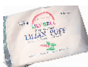
日本 LILIBELL 化妆棉 222片

带珠光的隔离霜,效果很赞的,用后皮肤能闪耀出自然光泽。另外,每天坐在电脑前的MM不妨也选用,减少辐射伤害。