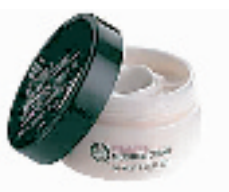
The body shop VE 保湿润肤霜 50ML

凝露状的保湿水,感觉类似精华液的质地,只要少量就能充分补充肌肤水分,同时使肌肤恢复明亮光泽。非常适合干性肌肤使用。