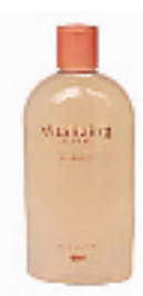
爱茉莉 太平洋平衡柔润水 310ml

涂抹瞬间会从凝露状转变成液状,一点都不会有黏腻感,让双唇水润丰盈!含有闪亮因子,让双唇光感圆润。本次代购只提供卖得最好的814号,大家可去专柜看好颜色。