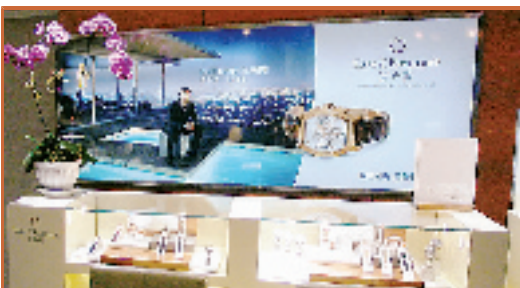
◆CARL F. BUCHERER 宝齐莱专柜