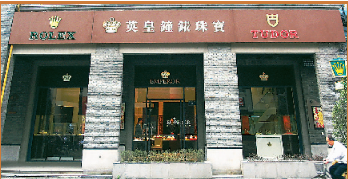
◆位于湖滨国际名品街的英皇钟表珠宝

隶属香港英皇集团的英皇钟表珠宝于一九四二年成立,已有六十多年历史,在国际钟表零售业务方面享有盛名,专门代理世界一级钟表品牌。