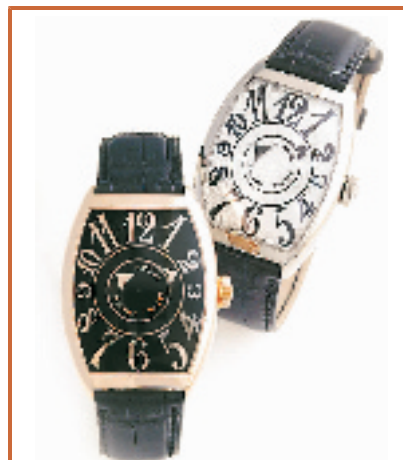
◆FRANCK MULLER 法兰克穆勒手表