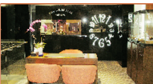
◆FRANCK MULLER 法兰克穆勒专柜

◆英皇乃顶级品牌劳力士于杭州的特约代理商 ◆沛纳海及法兰克穆勒两大国际名牌首次由英皇引入到杭州