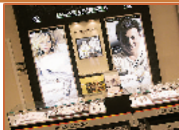
◆BAUME & MERCIER 名士专柜