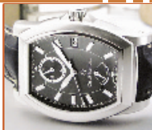
◆CARL F. BUCHERER 宝齐莱手表