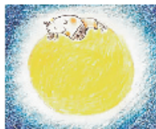
《北京的月亮》 是新专辑里的一首歌,这几年阿牛在内地的时间比较多。一看到圆圆的月亮就想家。