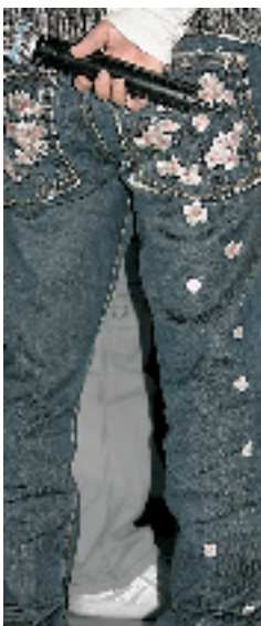
绣满桃花的牛仔褲要3000多人民币。