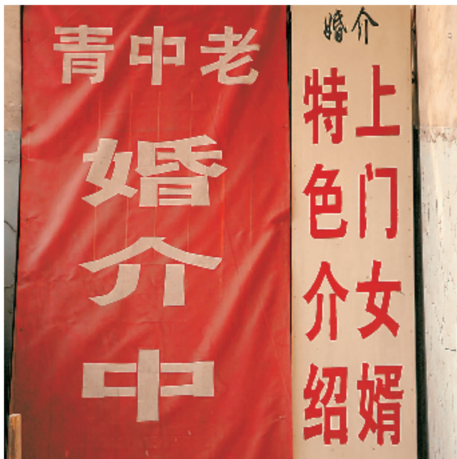
介绍上门女婿是“金点子”婚介的招牌服务