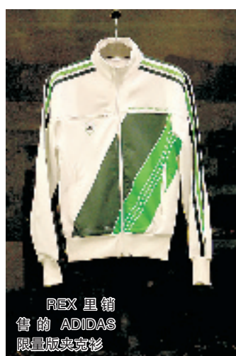
REX 里销售的 ADIDAS 限量版夹克衫