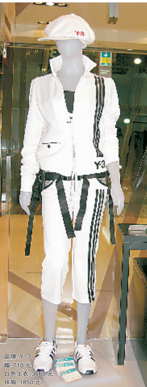
品牌: Y-3 帽: 710元 白色上衣: 3660元 抹胸: 1850元