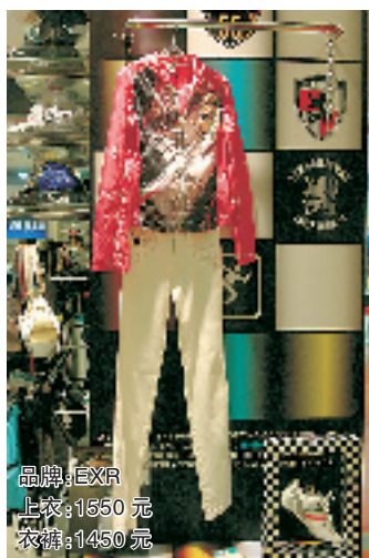
品牌: EXR 上衣: 1550元 衣裤: 1450元