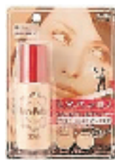
SANA 毛孔修饰润色隔离霜 25g

编号:042007 代购价:16元 能有效吸收油脂不泛油光,100%防水、防汗的功能、有效遮盖瑕疵,还有珠光效果呢。