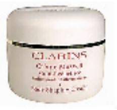
娇韵诗纤柔美体霜 200ml

如果你有任何疑问,请打电话到85311203咨询。付款以后即表示认同我们的代购方式,货品在无质量问题的情况下不接受退换货要求。汇款截止日期:4月26日下午17点整。