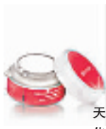
天竺葵乳晕粉嫩淡化霜 25ml

编号:042004 代购价:115元 质地清爽、容易吸收的浓缩精华乳,含多种植物萃取、植物精油及生化成分,持续使用能防止胸部松弛,恢复紧致曲线。