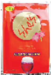
She's 净白保湿面膜 10包/盒

编号:042008 代购价:115元 《女人我最大》强力推荐,超惊人的遮盖毛孔效果,防晒指数SPF17 PA++。