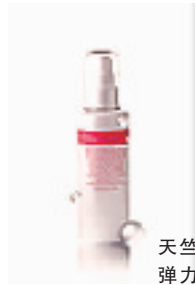
天竺葵弹力美胸精华乳 120ml

编号:042003 代购价:130元 含维他命C+E,质地清爽易吸收,可调理、柔软身体肌肤,适合天天使用。天然纯正的葡萄萃取液,具抗氧化、增加肌肤弹性。