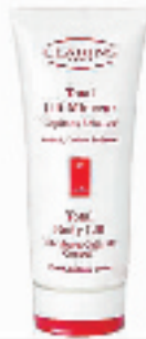
娇韵诗完全纤体精华霜 200ml

编号:042001 代购价:350元 专柜参考价:520元 MM们可以先去专柜看看,打听一下它的功效。只要抹在肥胖的部位,轻轻按摩片刻,不仅皮肤会越来越光滑滋润,肥胖的部位也会悄悄变细呢,这个在坛子里口碑很好的呢!