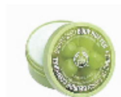
TheBodyShop葡萄籽抗氧化身体滋养霜 200ml

编号:042002 代购价:318元 专柜参考价:420元 跟你的橘皮说再见吧!很早以前就梦想着有这么一支精华霜了,现在有人专程为我们从法国代购,赶紧抓住机会吧!也可配合在纤柔美体霜之前使用。