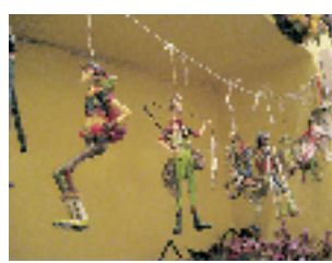
行走者系列小挂件