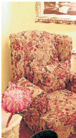
赫本时期的田园沙发