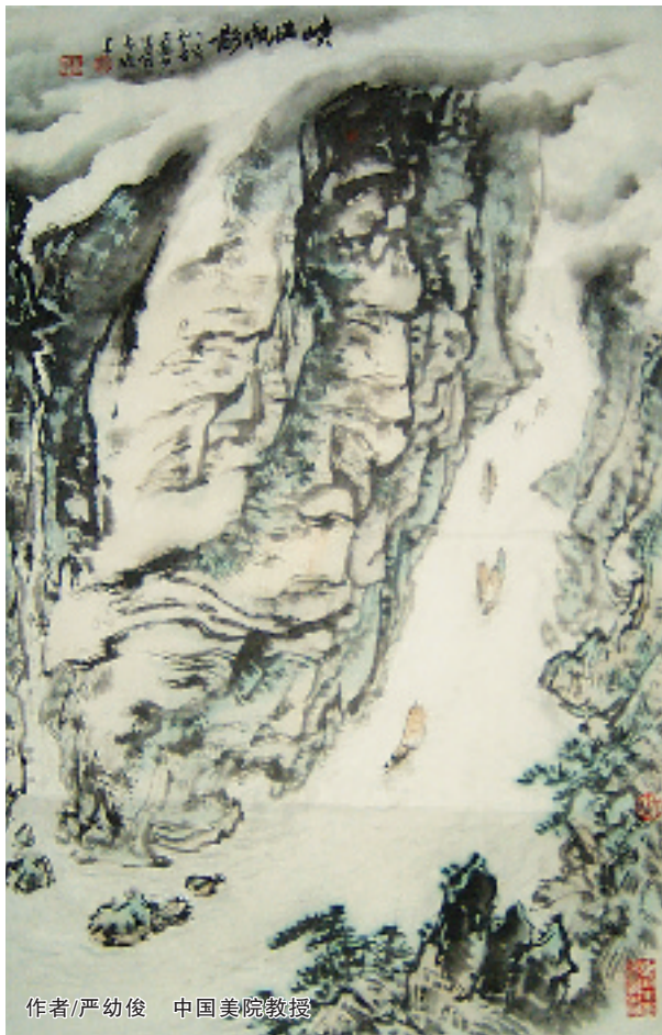
作者/严幼俊 中国美院教授

杭州艺融文化艺术策划有限公司专为本刊读者推出“书画艺术品大抽奖、人人有奖”活动，抽奖作品包括89件绘画作品，11件书法作品，20件青瓷艺术品，总共120件。活动设立120个抽奖号，每一个抽奖号对应一件作品，读者只需拨打报社的活动热线电话进行登记，并且按下述付款方式缴纳每一个抽奖号300元的费用，即可在5月19日到指定地点凭付款凭证参加现场抽奖活动，每人最多限报5个名额。本次活动最高奖为价值9000元的山水画，价值最低为每幅500元左右书法作品，70%以上奖品市场价值超过1000元，确保人人有奖，您只需投三百元，就有可能获得九千元大奖，至少也能得到价值500元的保真作品。