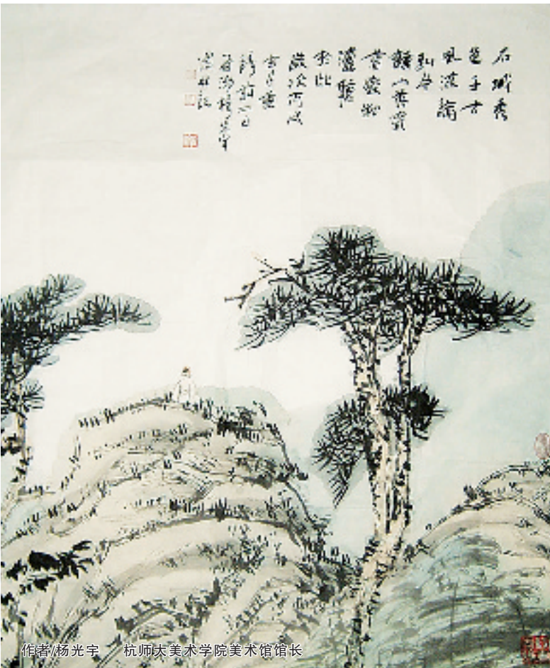
作者/杨光宇 杭师大美术学院美术馆馆长