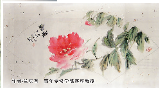
作者/竺庆有 青年专修学院客座教授