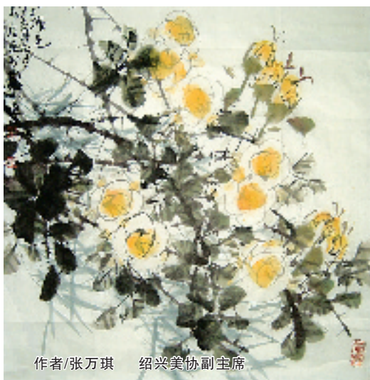
作者/张万琪 绍兴美协副主席