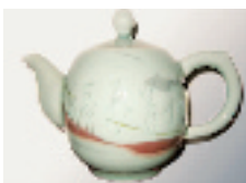
作者/毛松林 高级工艺美术师