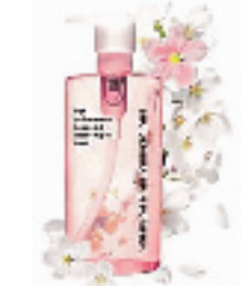
植村秀卸妆油(樱花)150ML

香调:清新花果香调 前味:小黄瓜、葡萄柚、木兰花 中味:白铃兰、紫罗兰、玫瑰、夜来香 后味:檀香木、黄金木、白琥珀