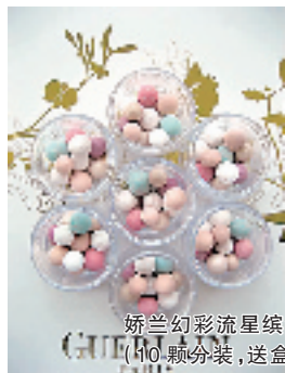
娇兰幻彩流星缤纷粉球 (10颗分装,送盒)

美白,除垢,抑制牙菌斑,预防牙周病,预防口臭,口气清新。三重美白配方,将牙刷沾湿,沾取适量牙粉,依正确方式刷牙。保存期限:三年。