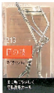
SHISEIDO 超广角卷翘睫毛夹

日本药妆店卖得超好的海绵,让你告别毛毛腿。夏天露出腿毛真的很烦哦,拔会痛,刮又会会长出的毛变粗。这个海绵有特别的设计,一面可除毛,另一面可以去角质,以画圆方式擦拭约6-8次,能去除体杂毛、细毛以及肥厚角质。