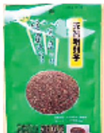
有机满腹种子——风靡日本的减肥良品