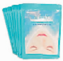
Lifecella 精华液果冻面膜(单片)

昭贵芦荟鲜汁,可以用于晒后修复。洁肤后取本品适量轻轻拍于面部,会立即感到凉爽舒适。还可泡纸膜敷脸或DIY面膜,还可以用于润肤、护发。