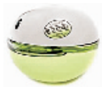
DKNY 青苹果女香 30ml

这个和上次代购的不一样,是Emilio Pucci与娇兰合作设计的07年夏季限量版。按原装粉球大小和颜色比例,每10颗分装一盒。可用来随意轻刷全脸、肩颈肌肤,能让肌肤更明亮有质感、强化五官轮廓的粉嫩色泽。