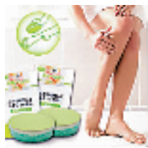
日本神奇无痛除毛海绵

如果你有任何疑问,请打电话到85311203咨询。付款以后即表示认同我们的代购方式,货品在无质量问题的情况下不接受退换货要求。汇款截止日期:5月17日下午17点整。