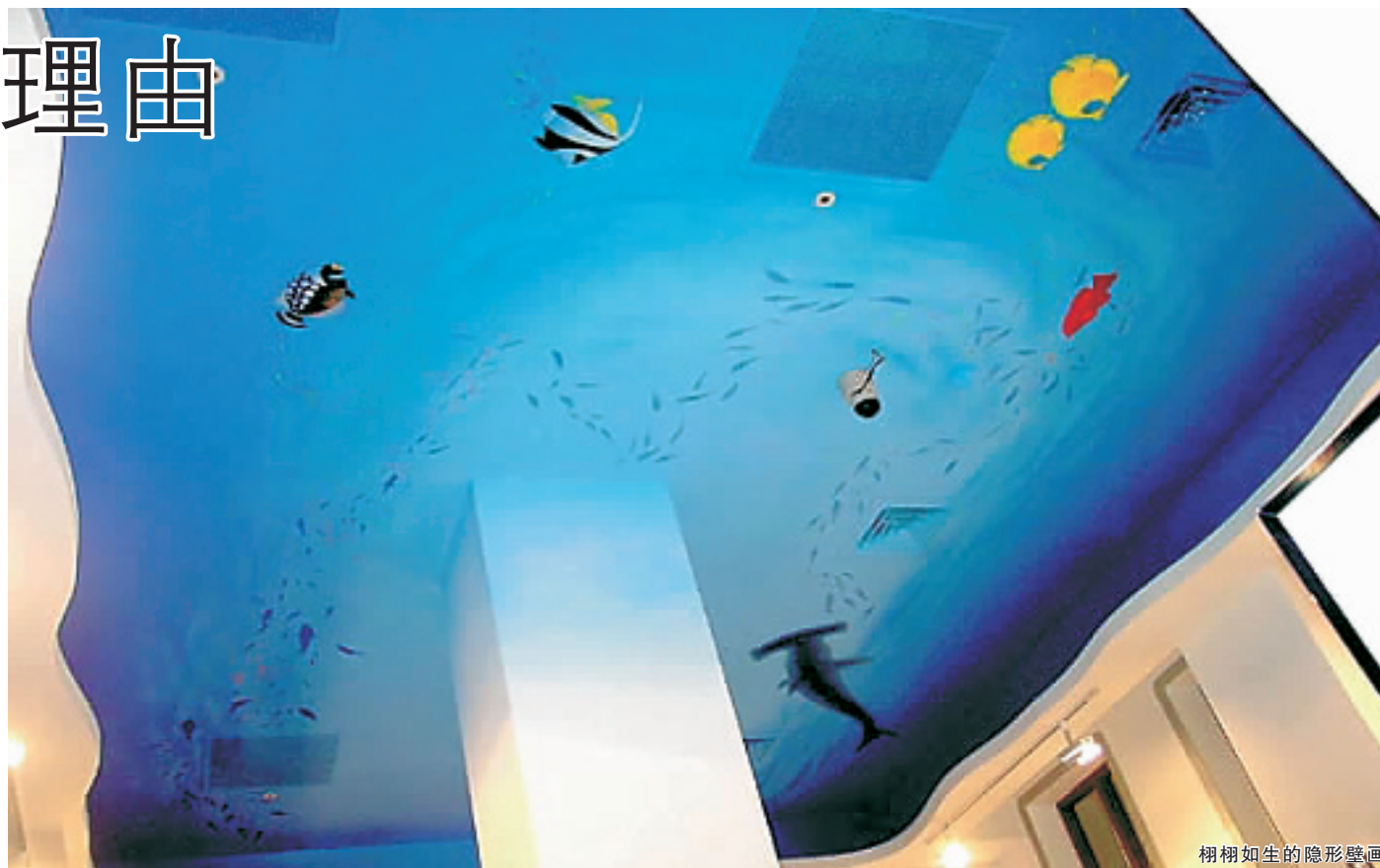
栩栩如生的隐形壁画