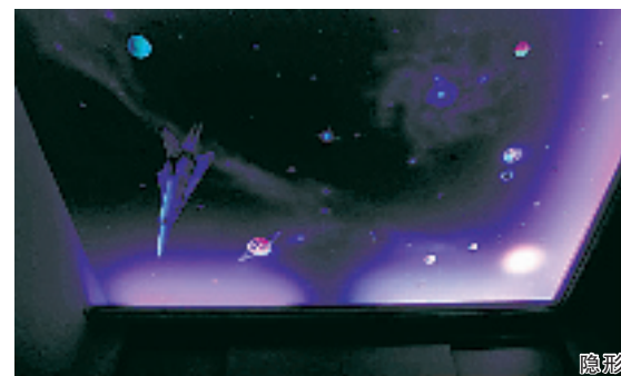
隐形壁画的两重天