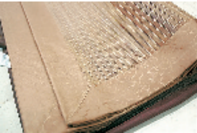
胜伟藤席三件套 239元/套