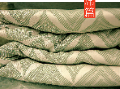
胜伟亚草凉席三件套 69元/套